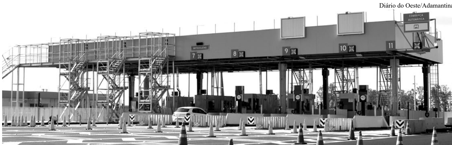
Praça de pedágio localizada no km 581+700 da SP 294, na altura de Inúbia Paulista, um dia antes do início do funcionamento

de pedágio, no mesmo sentido de fluxo e dentro de um mesmo mês calendário.