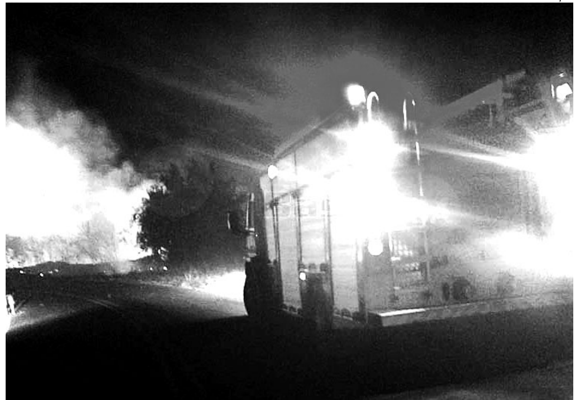
Viatura dos bombeiros de Tupã chega para o combate às chamas que se alastraram por matagal