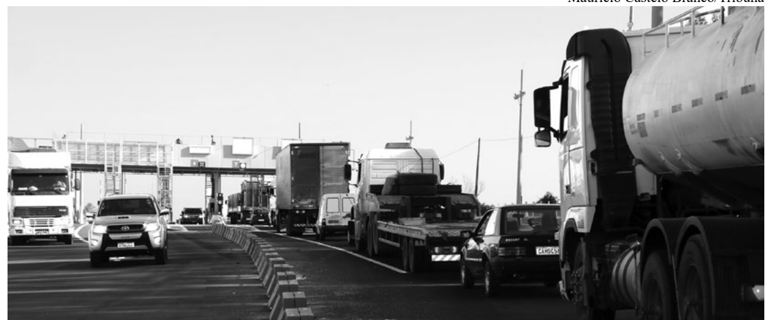
Fila de veículos na unidade de cobrança da Eixo SP em Parapuã, no sentido de Osvaldo Cruz