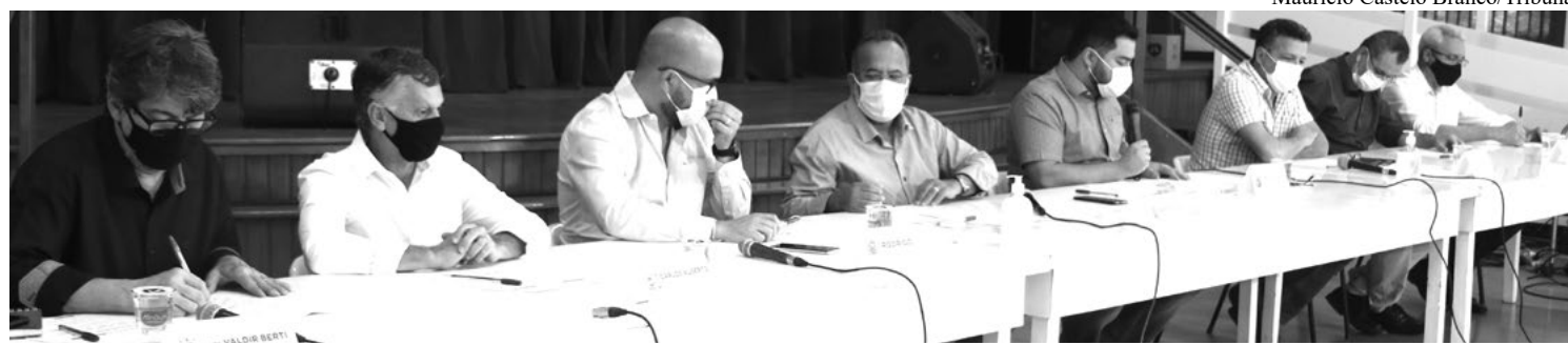
Em coletiva de imprensa, o secretário de Educação de Tupã e os prefeitos de sete das 10 cidades que adotaram a medida em conjunto

A decisão, que contraria recomendação do governador João Dória para a retomada das aulas presenciais em agosto, foi oficializada por meio de decreto padronizado, publicado terça-feira