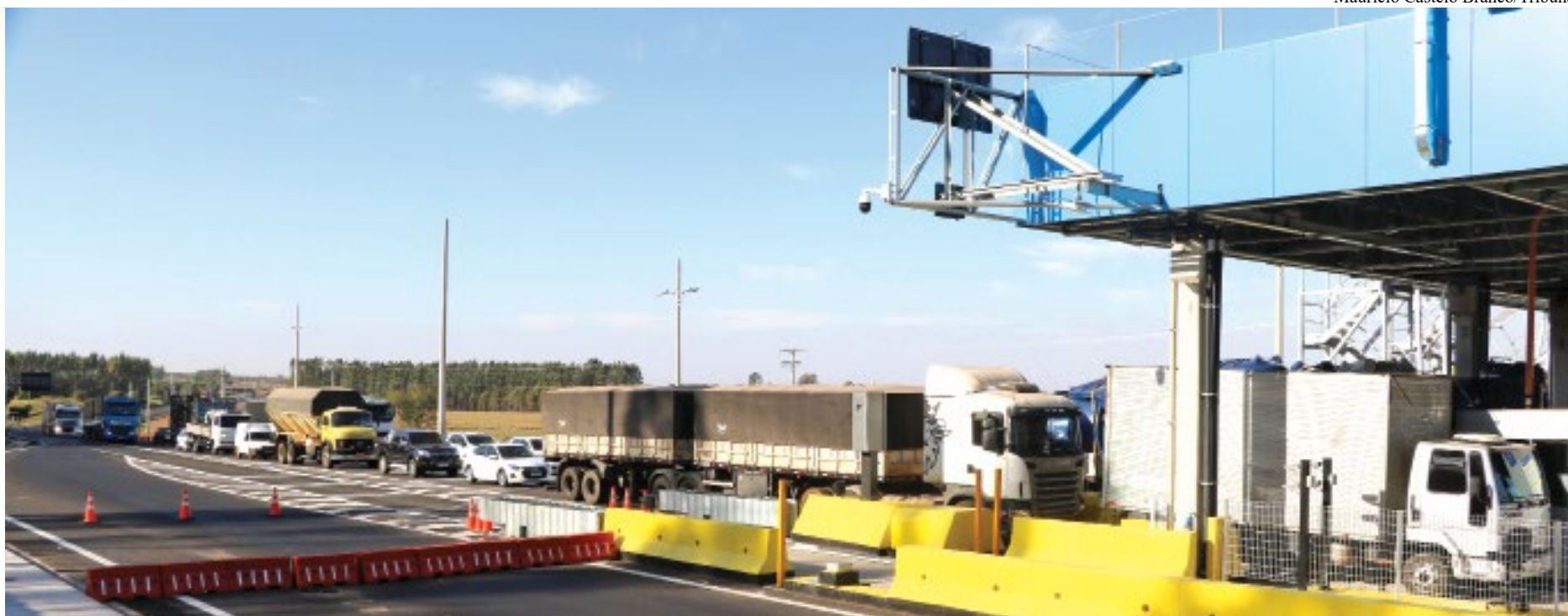
Fila de 150 metros na praça de pedágio da Eixo SP em Parapuã; na estreia ontem, a demora, durante ao menos meia hora, motivou buzinaço como protesto