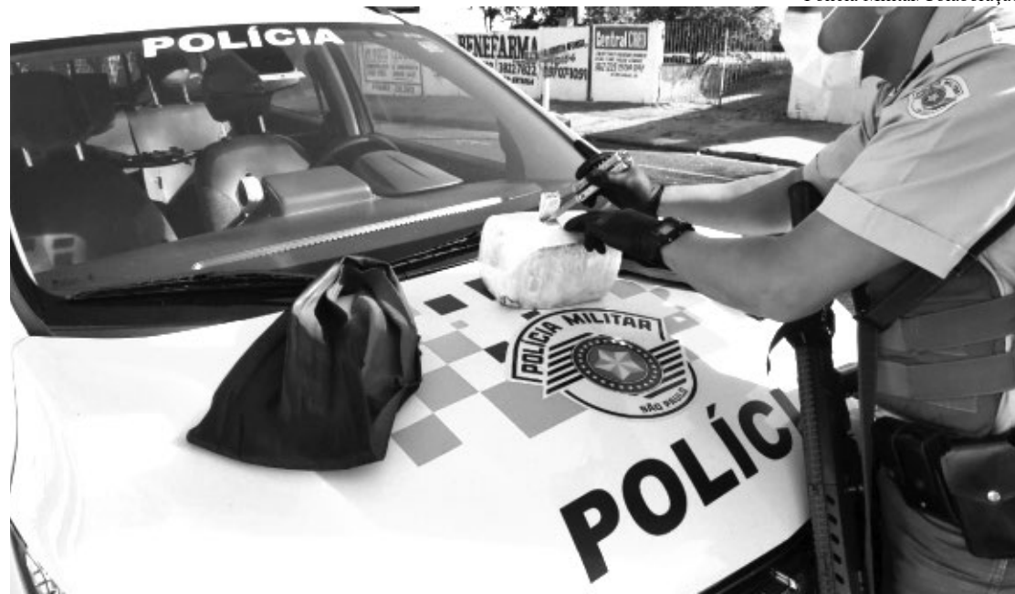
Policial rodoviário do TOR faz teste para identificação de droga logo após a apreensão na SP 294